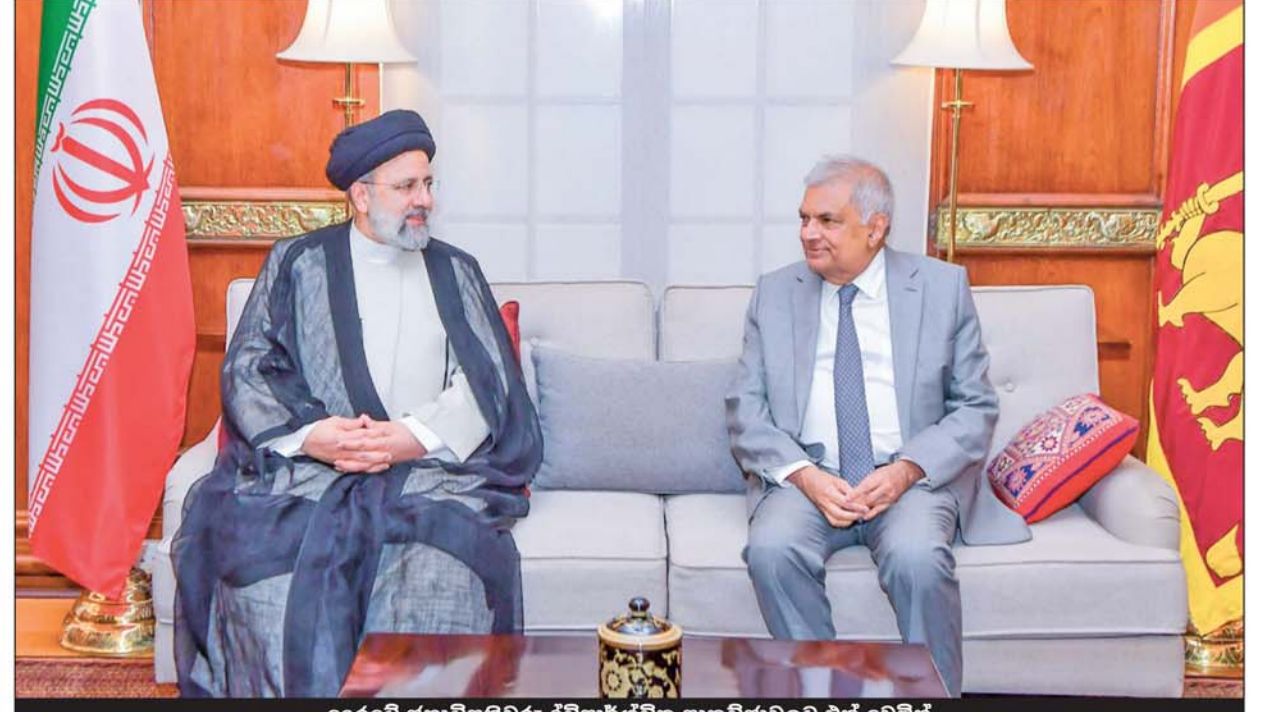
දෙරටේ ජනාධිපතිවරු ද්විපාර්ශ්වික සාකච්ඡාවලට එක් වෙමින්