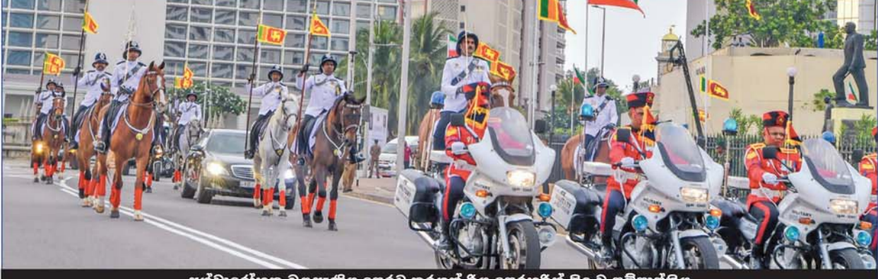
අශ්වාර්යේහක ඔළඳුණිය පෙරටු කරගත් රිය පෙරහරින් සිදු වූ සම්ප්‍රාප්තිය