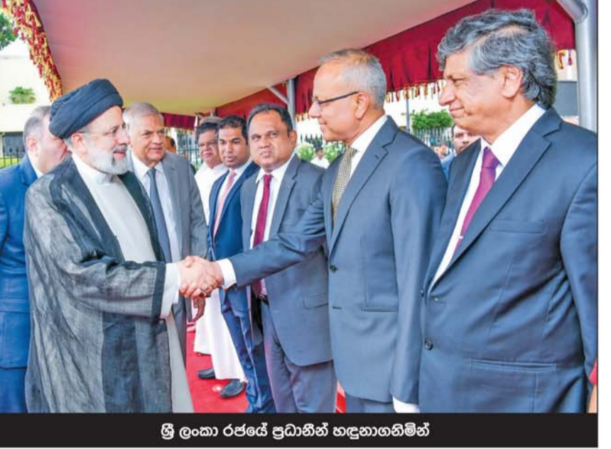
ශ්‍රී ලංකා රජයේ ප්‍රධානීන් හඳුනාගනිමින්