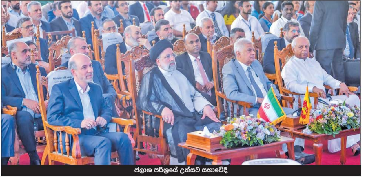
ජලාග පර්ලුයේ උත්සව සහාවේදී