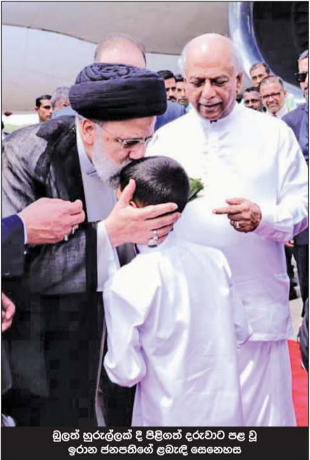
බුලත් හුරුල්ලක් දී පිළිගත් දරුවාට පළ වූ ඉරාන ජනපතිගේ ළඹැඳි සෙනෙහස