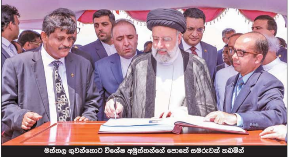
මත්තල ගුවන්තොටු විශේෂ අමුත්තන්ගේ පොතේ සමරුවක් තබමින්