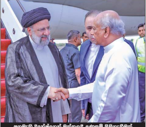
අගමැති දිනේෂ් ගෙනේ මත්තලදී උණුසුම් පිළිගැනීමක්