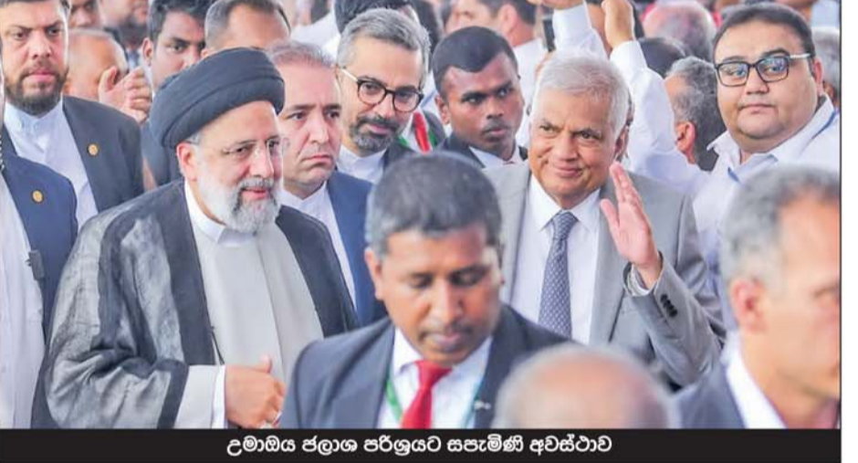
උමාඔය ජලාග පර්ලුයට සපෑමිණි අවස්ථාව