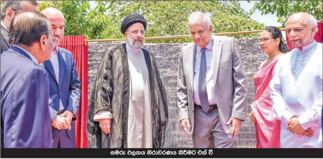
සමරු එලකය නිරාවරණය කිරීමට එක් වී