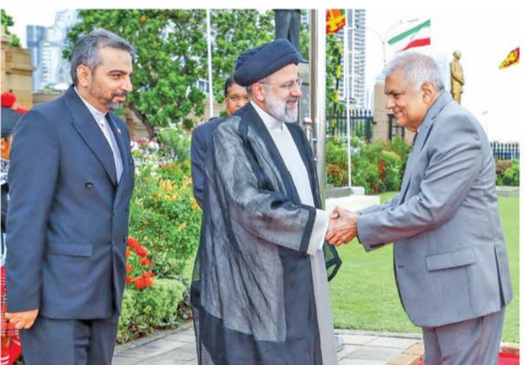
ජනාධිපති ලේකම් කාර්යාලය අඹිමුවදී ජනපති රනිල් විසින් පිළිගනු ලබමින්